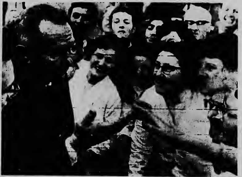
Prome minister Sovietico Alexei Kosygin ta haña miradanan di admiracion y saludo di trahadornan di un compania caminda nan ta traha computer na Londres durante un bishita qu el a hasi ayera. Despues den London Guildhall el a avisa Merca pa stop di bombardea Nor Vietnam promer qu nan cuminsa combersa riba paz.

"Nazinan a cuminsa cu reunionnan dozijnnan y centenares di persona den uncervceria di Mu-